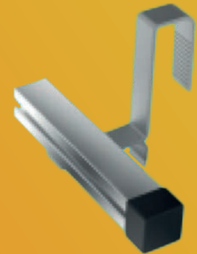
Hellend dak - Dakhaak + montagerail

Alle materialen voor het systeem zijn vervaardigd uit hoogwaardig aluminium en RVS. De systemen zijn getest onder zware condities en voldoen aan alle richtlijnen met betrekking tot dak-, wind- en sneeuwbelasting. Op dit systeem zit 20 jaar productgarantie.