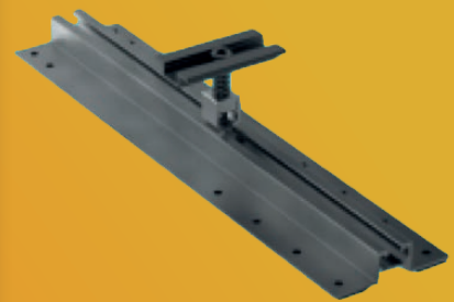
Montage systeem - damwand / sandwich daken

Voor damwand/sandwich daken gebruiken we trapezoïde profielen van het Nederlandse SolarStell. De trapezoïde profielen worden door middel van smeltschroeven of popnagels op het dak vast gezet. Doordat de korte profielen reeds zijn voor geponst en voorzien zijn van EPDM hebben we voor installatie maar drie artikelen nodig. Doordat het systeem zeer compact is betekent dat nog meer gemak op het dak voor ons als installateur. De profielen zijn vervaardigd uit hoogwaardig, duurzaam aluminium en voorzien van een EPDM laag voor een waterdichte afdichting.