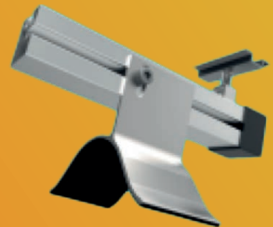
Montage systeem - Golfplaten dak

Op het gehele systeem geeft Solarstell 20 jaar garantie.